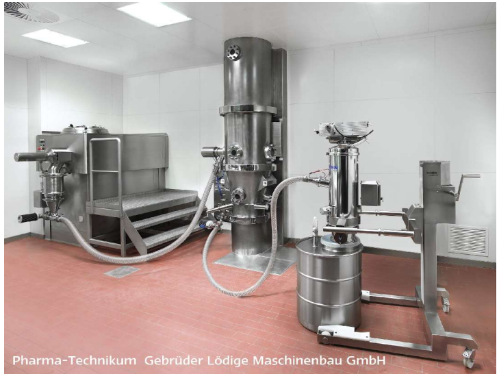
Der selbe Förderer wird auf einem Transportwagen zur Entleerung des Fließbedrockners (mitte) in ein Faß verwendet