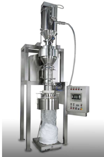
Vakuum Förderer (oben) zum beladen eines Sieb-/Mühlprozesses und Abfüllung in Säcke