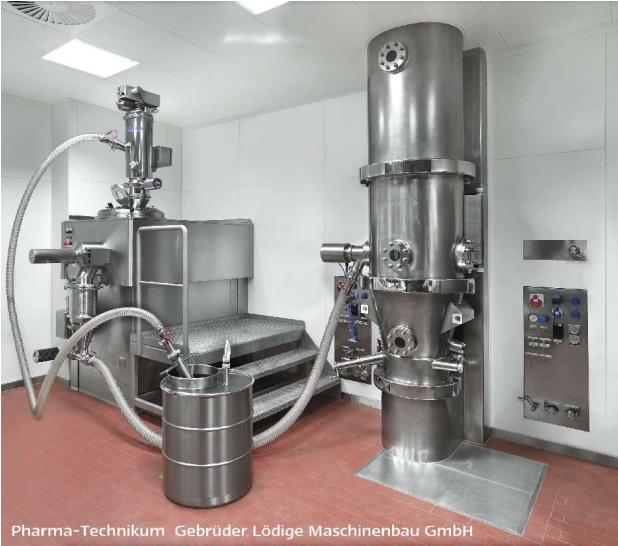
Entleerung des Fasses und beladen des Mischers (links oben) mit pharmazeutischem Pulvern